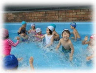
ペンぎんぐみ (3 歳児)

プール開きの時、楽しみに読んで来た「ぐりとぐらのかいすいよく」の絵本に出てくる、うみぼうずから手紙がきました。手紙には、「みんなが遊んでいる様子を見守っているよ」と書いてあり、みんな、とても喜んでいました。「うみぼうずさん、見ていてね！」と、色々な泳ぎ方を見せてくれながら楽しんでいました。手紙と一緒に届いた、うみぼうずの人形は、夏の間、みんなを温かく見守ってくれています。