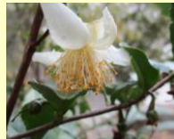
甘い香りがするよ