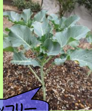
スティックセニョール