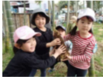
こんな大きいのが 採れたよ!