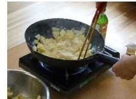
炒めて 食べました!