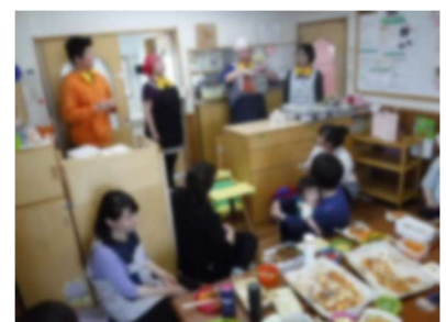
会食中は新人職員の出し物が行われました!