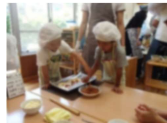
ミートソースをかけます