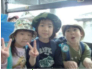
バスに乗って 行くよ!

4月17日、ぺんぎん・くじらグループは島田農園へ行き、たけのこ掘りをしてきました。その後、たけのこを使ってクッキングもしましたよ。